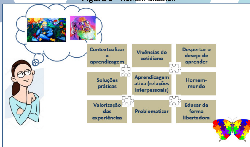
Figura 2 - Retrato didático

A especialização me fez admirar ainda mais o legado de Paulo Freire, a despertar para a importância do ser social, de que não se pode dissociar o homem social no processo de educar. Na disciplina “Didática e avaliação da aprendizagem aplicada a educação profissional integrada à EJA” foi pedido em uma das unidades que nós fizéssemos um retrato didático que remetesse a expressão “QUE PROFESSOR/A EU SOU OU QUERO SER?”, abaixo, na figura 2, segue o meu retrato didático que deixa evidente a minha admiração pelo filósofo Paulo Freire.