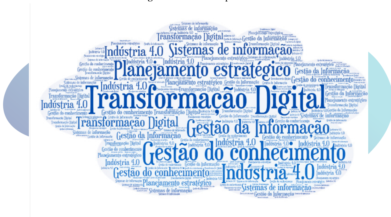
Figura 4 - Nuvem de palavras

synthesized in 177 different words. The highlight was the key word Digital Transformation with 33 occurrences, Knowledge Management with 18; Strategic planning with 11 occurrences, Information Management with 10, Industry 4.0 with 8 and Information Systems with 7. The other occurrences were not considered in this article, as they appear with a frequency considered low and are only six times. As shown in figure 1 below: