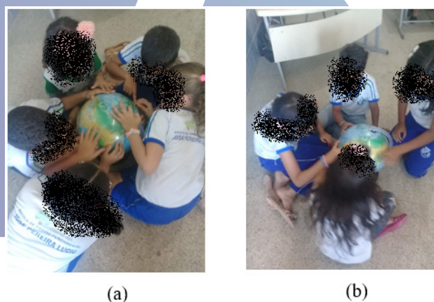
Figura 3 – Um passeio pela África

Posteriormente solicitamos a ilustração da capa do livro (o mais próximo que pudessem chegar da imagem original), com o intuito de observar se ainda haveria uma rejeição acerca da cor da pele da personagem. Em seguida adentramos na Geografia. Nesse momento, fomos em busca de conhecer alguns países africanos. Realizamos um “passeio” pela África. Os estudantes exploraram o mapa mundi (globo) encontraram a África e seus 56 países, em seguida pintaram o mapa da África e colaram no caderno, como se observa a partir da figura 3.