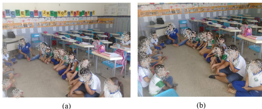
Figura 2 – Leitura em roda de conversa