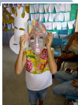
Figura 4 – Produzindo máscaras

Outra atividade desenvolvida se refere as pesquisas no laboratório de informática sobre a história e o significado das máscaras africanas, cada criança escolheu uma máscara para imprimir, recortar e pintar, trabalhamos a Arte, mesmo com as nossas limitações diante de recursos (material didático), em seguida foram desenvolvidas algumas brincadeiras de origem africana, com atividades de Educação Física por meio das brincadeiras, movimento e ritmo (acompanhe meus pés, cauda do dragão, saltando o feijão, escravos de Jó, etc.), como se percebe a partir da figura 4.