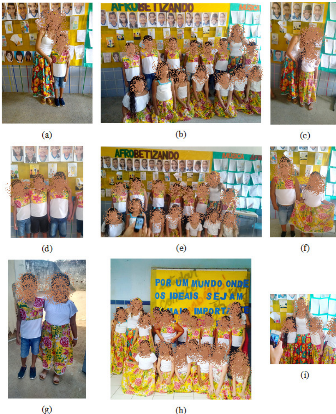
Figura 6 – Culminância do projeto