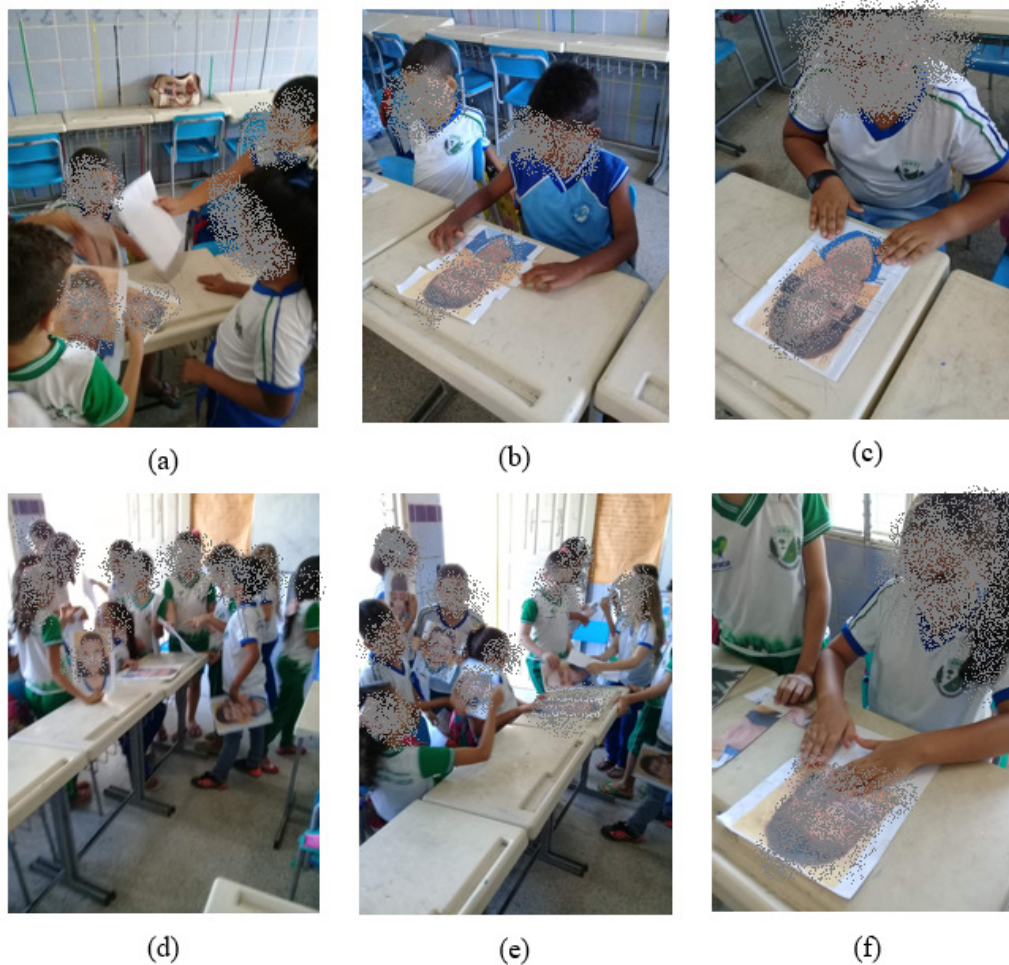
Figura 5 – Mosaico de fotografias