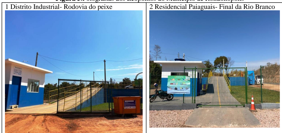
Figura 3. Fotografias dos Ecopontos do Município de Rondonópolis

As fotografias abaixo apresentadas na Figura 3 foram capturadas pelos autores no dia 17/07/2021 nas quais se observam as entradas dos Ecopontos de Rondonópolis.