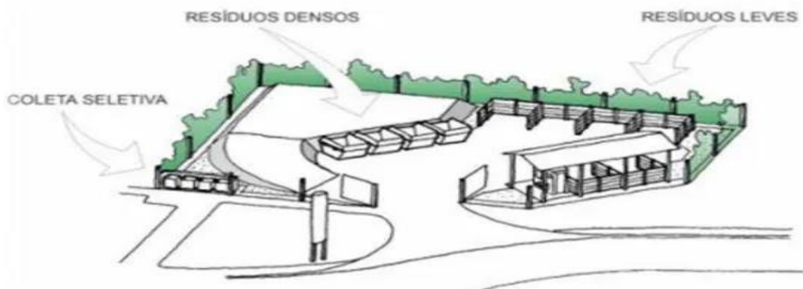
Figura 1. Croqui de Ecoponto

A ABNT NBR nº 15.112 dispõe sobre os resíduos da construção civil e resíduos volumosos; Áreas de transbordo e triagem; Diretrizes para projeto, implantação e operação. As áreas de operação dos Ecopontos devem ser cercadas, com o intuito impedir a entrada de animais e pessoas estranhas à atividade, possuir cercas vivas e uma guarita para a identificação dos usuários. Para a separação do material recebido devem existir caçambas e baias separadas, conforme Figura 1.