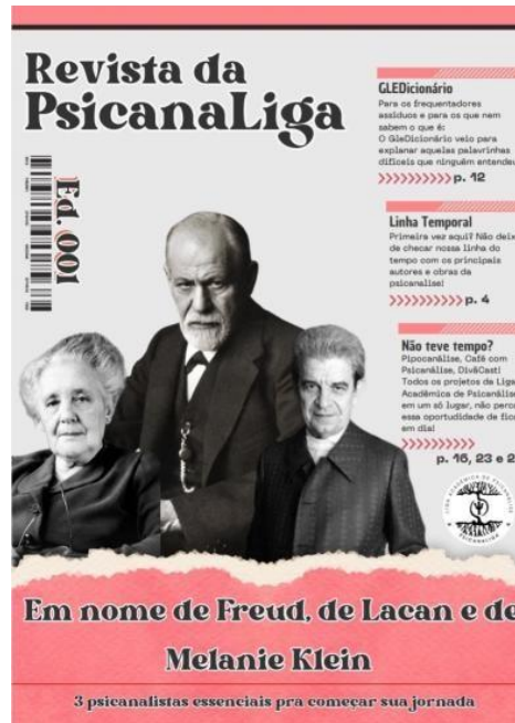
Figura 1 – Capa da 1ª edição da Revista da Psicanaliga: Em nome de Freud, de Lacan e de Melanie Klein