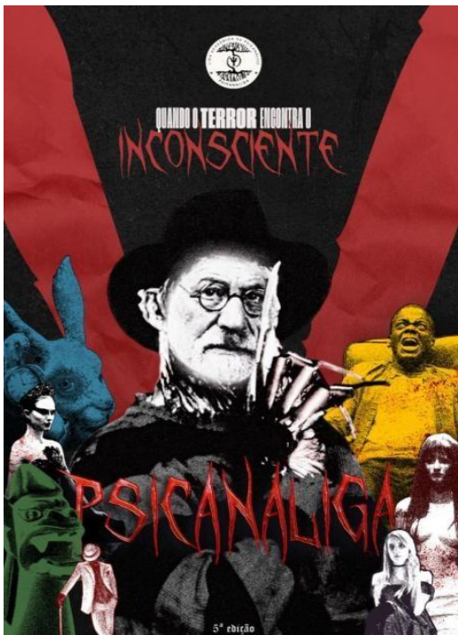
Figura 5 – Capa da 5ª edição da Revista da Psicanálise: Terror e Psicanálise