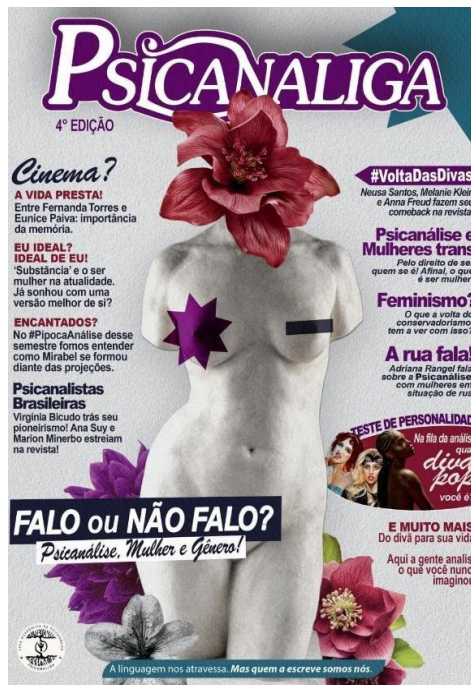
Figura 4 – Capa da 4ª edição da Revista da Psicanaliga: Falo ou Não Falo? Psicanálise, Mulher e Gênero