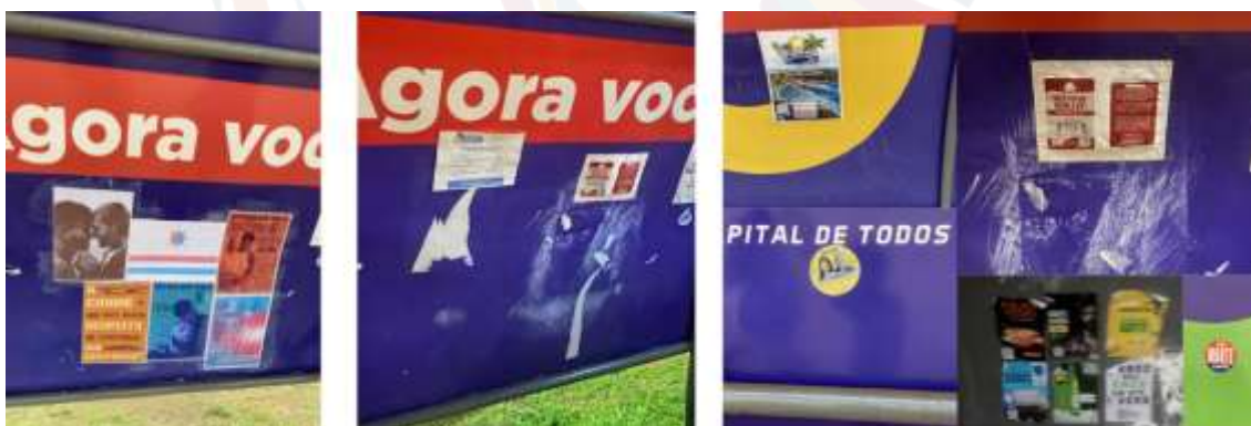
Figura 16 – Intervenção com lambe-lambes na Estação Xambioá: aplicação e remoção das mensagens