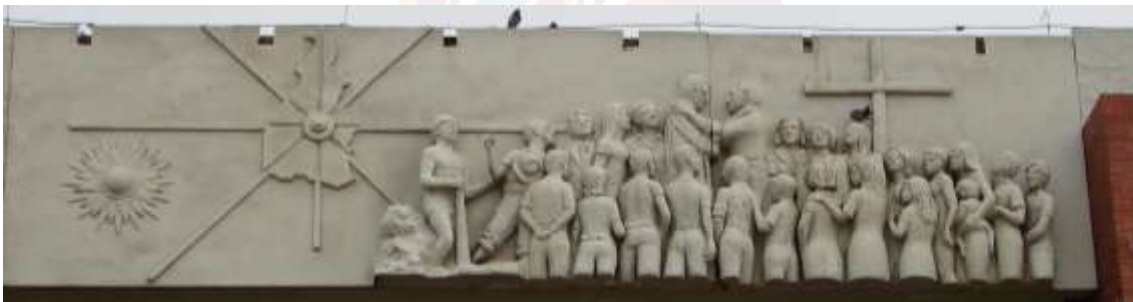
Figura 6 – Detalhe da escultura exterior do Palácio Araguaia

Em Palmas, o Cruzeiro de pau-brasil reproduz esse duplo gesto colonizador-estatal, funcionando simultaneamente como monumento religioso, inscrição geográfica e ato de posse territorial. Nas análises de Reis (2011) sobre a espacialização hierárquica do poder na capital, a participação de representantes do povo Xerente ao lado do governador Siqueira Campos na inauguração do Cruzeiro constitui uma tentativa simbólica de associar colonizador e indígenas, resinificando, porém, relações desiguais de dominação. (Figura 6), em que figuras indígenas ocupam posição secundária em composição monumental centrada na autoridade estatal. Ecoando a pintura Primeira Missa no Brasil (1860), de Vítor Meireles, na qual indígenas aparecem como moldura decorativa para o ritual cristão, consolidando iconograficamente a ideia de submissão cultural e religiosa dos povos originários.