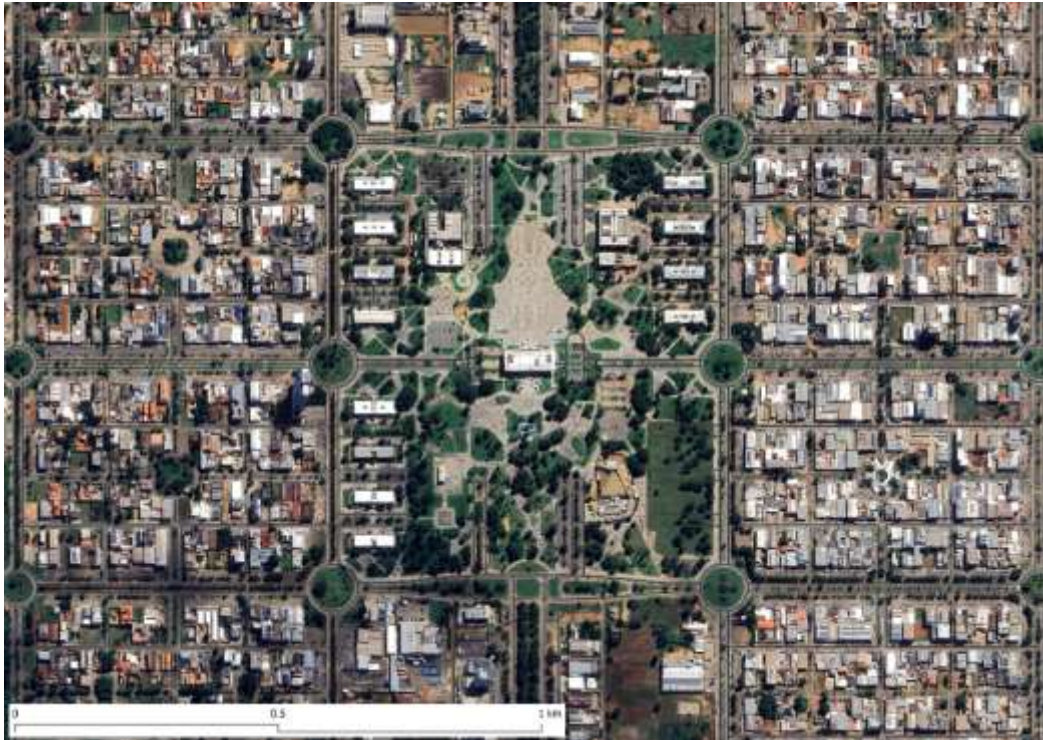
Figura 1 – Macroquadras das regiões centrais e Praça dos Girassóis

Fonte: Google Satélite (2024). Elaborado pelos autores no QGIS.