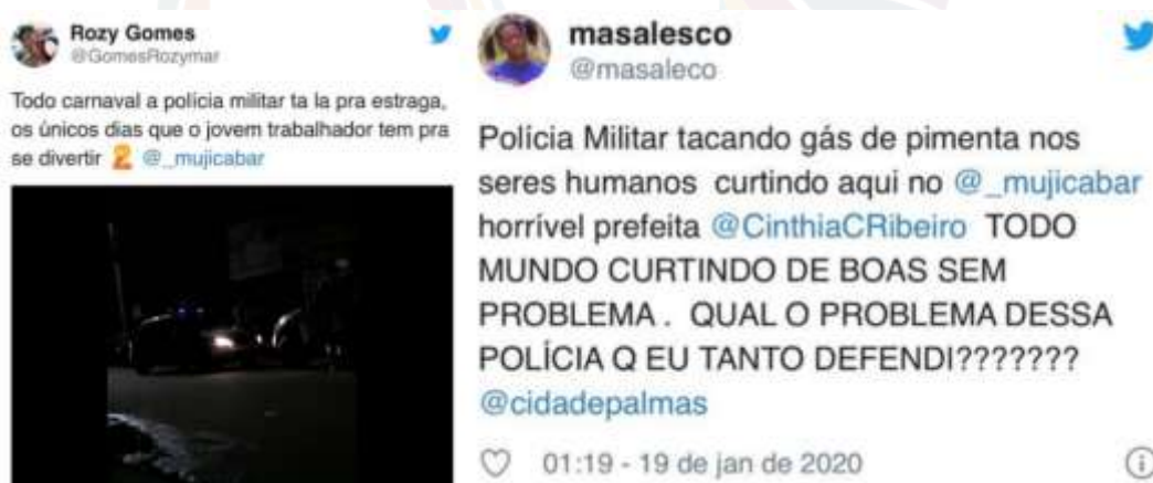
Figura 10 – Publicações online sobre a intervenção policial no Mujica Bar durante evento de pré-carnaval

Fonte: Montagem elaborada pelos autores a partir de publicações disponíveis em X (2024).