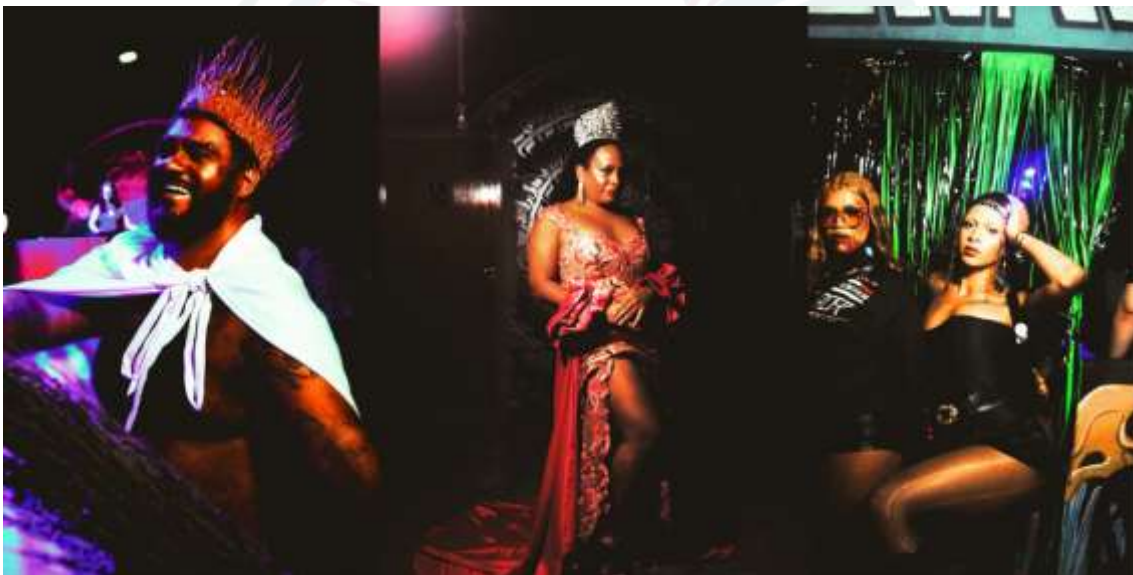
Figura 14 – Registro de performances e sociabilidade no Baile Della, em noite de vogue

Fonte: @cameraxt, Instagram (2025). Adaptado pelos autores.