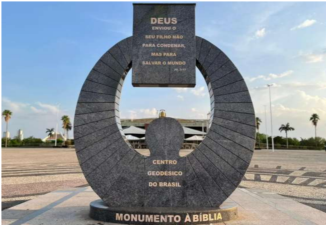
Figura 7 – Monumento à Bíblia