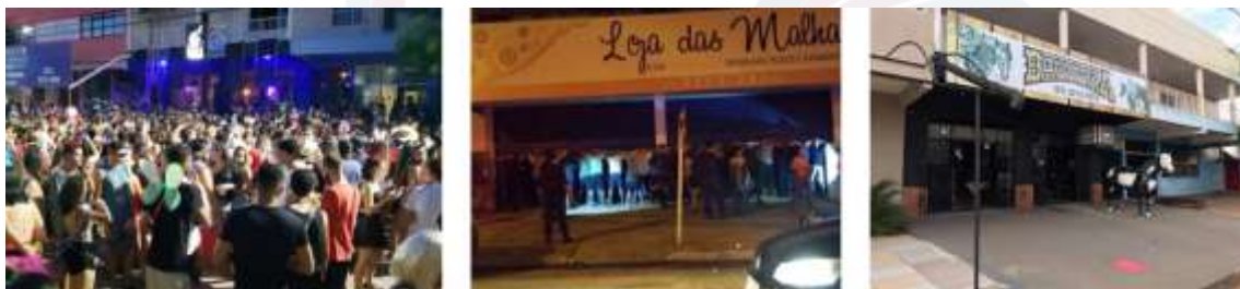
Figura 11 – Mujica Bar antes de seu fechamento, abordagens policiais e, atualmente, a loja Bonanza Country