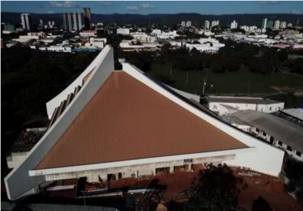
Figura 8 – Catedral do Divino Espírito Santo