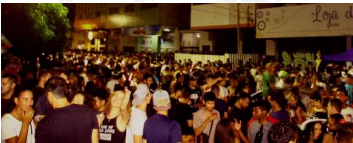
Figura 9 – Rua cheia em frente ao Mujica Bar

Vasconcelos e Vasconcelos (2014, p. 75) observam que a festa pode operar como “válvula de escape” que permite a grupos marginalizados suportar injustiças estruturais. Em Palmas, essa função é radicalmente reconfigurada: a festa é capturada pelo Estado e transformada em ferramenta de reafirmação da ordem cristã-neoliberal. Nesse contexto, em 2019 o Mujica Bar, estabelecimento LGBTI+ que funcionava como espaço de sociabilidade alternativa desde 2017, converteu-se em epicentro do carnaval palmense, sem financiamento público ou chancela oficial. O chamado CarnaMujica reuniu, segundo relatos da época, um grande público que ocupou a rua em frente ao bar (Cotrim, 2019), tornando visível precisamente aquilo que a Lei n. 2.357 (Palmas, 2017) pretendia negar: um espaço de celebração plural, em que gostos e credos se encontravam sem condenação heteronormativa.