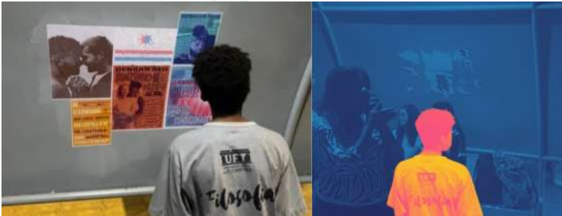
Figura 17 – Intervenção com lambe-lambes na Estação Apinajé: encontro com crianças; montagem com sobreposição de registros da remoção da intervenção e manipulação de cores