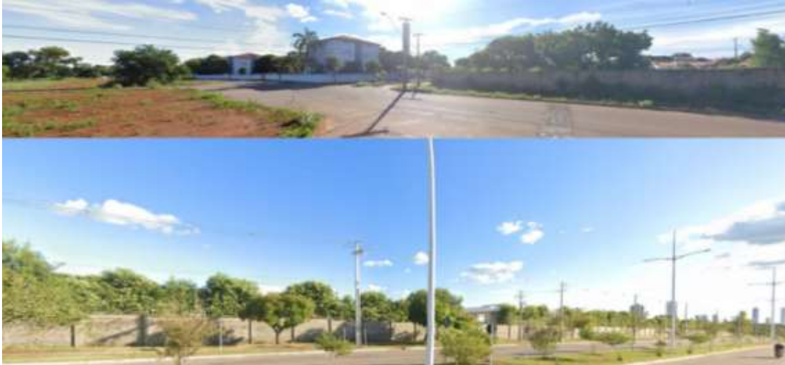
Figura 2 – Vista da Quadra 406 Norte (Alameda 1), na região norte de Palmas, e da Quadra 103 Sul (Avenida LO-03)