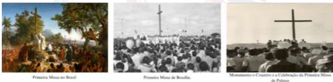
Figura 5 – Celebrações de missa em momentos fundadores da história brasileira