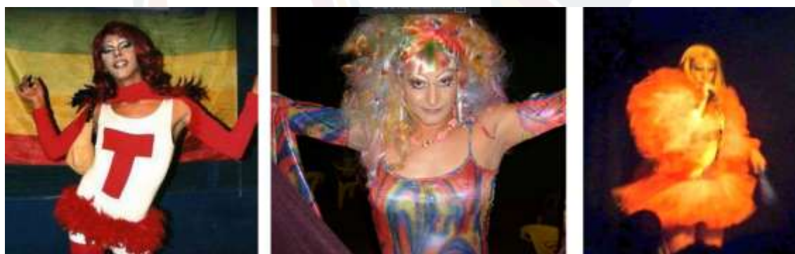
Figura 13 – Apresentação de drag queens no palco principal

Análises de Irineu e Amaral (2022) destacam o papel de iniciativas culturais LGBTI+ na construção de redes de cuidado, pertencimento e reinvenção identitária em cidades marcadas por forte presença religiosa e por violências de gênero. Em Palmas, as apresentações de drag queens no palco principal da Dama de Paus (Figura 13) materializam esse caráter de contraespaço : performances exageradas, maquiagem e figurinos tensionam normas de gênero e respeitabilidade e, na leitura de Butler (2018), expõem a dimensão imitativa e contingente do gênero, tensionando as normas de respeitabilidade e visibilidade que sustentam o armário urbano.