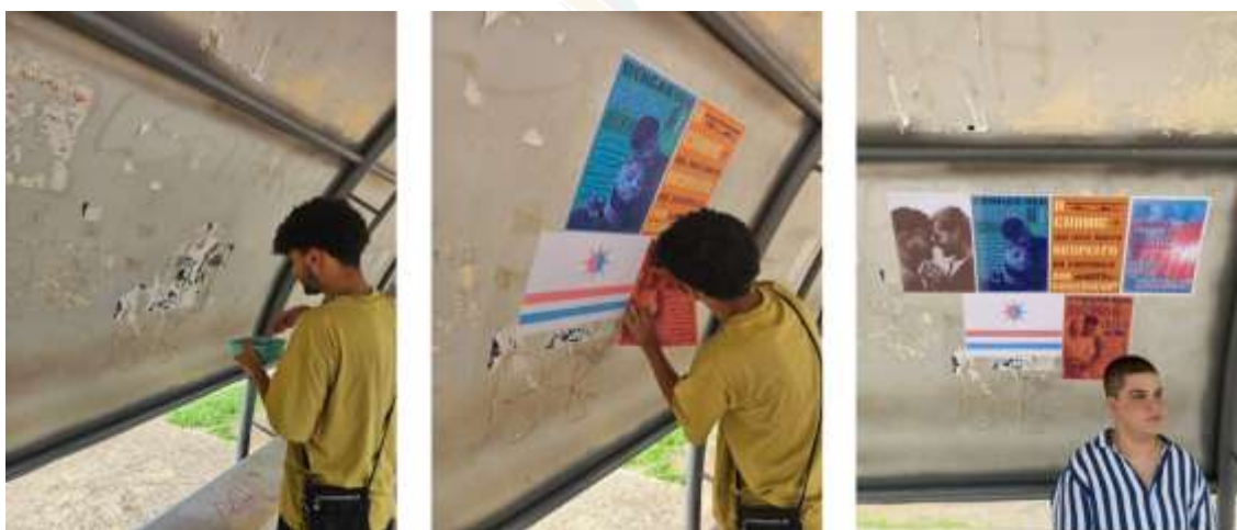
Figura 15 – Estação Xambioá: aplicação e resultado da intervenção