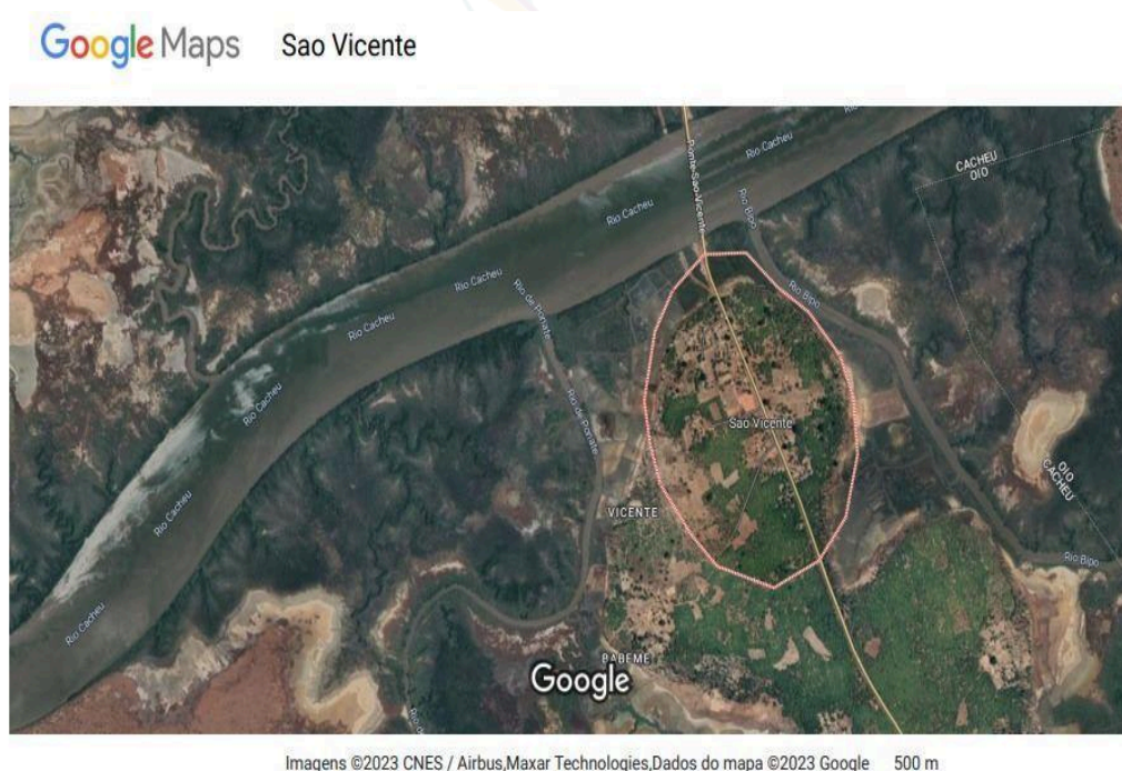
Figura 2 - Mapa de São Vicente.

Ainda de acordo com Bayan (2015), foi por meio das ditas "culturas de renda", como amendoim e caju, que se adotaram estratégias para a obtenção do arroz em falta. Porém, essas culturas concorrem na utilização dos terrenos de cultivo, que alteram o equilíbrio da dieta alimentar felupe , e permitem um acesso, aparentemente, "mais facilitado a rendimentos", porque deixam os produtores muito dependentes das diretivas do governo guineense, que são impostas pelas flutuações bruscas de preços e de mercado global.