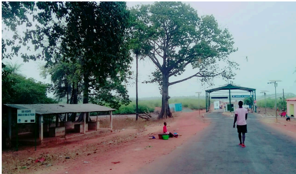
Figura 1 - Ponto de venda das ostras em São Vicente.

geralmente, é um local onde as mulheres felupes vendem as ostras, após serem pescadas e tratadas.