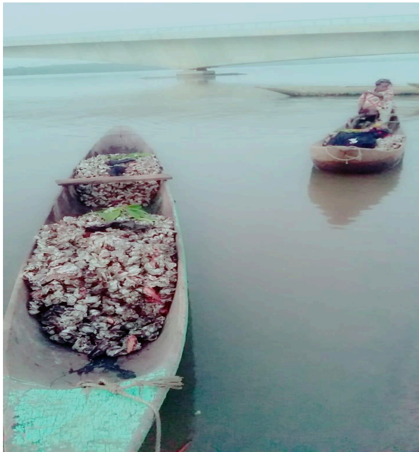
Figura 4 - Chegada de uma mulher felupe com as ostras na canoa.