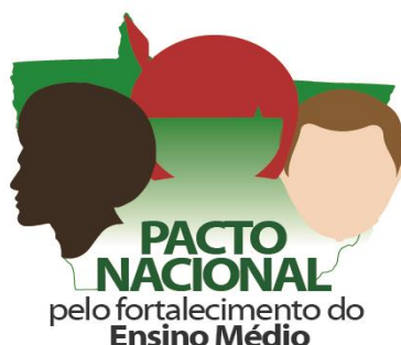
Figura 02 – Logomarca do Pacto Nacional pelo Fortalecimento do Ensino Médio no MT

O desenho permitiu refletir sobre a escola como locus de formação, considerando o número aproximado de 30(trinta) professores por turma organizada preferencialmente por unidade escolar, sempre analisando as especificidades de cada realidade escolar e os aspectos relativos às diversidades educacionais: Escola Urbana, Escola do Campo, Escola Indígena, Escola Quilombola, EJA, CEJA, Salas Anexas. A preocupação com a diversidade mato-grossense se refletiu inclusive na construção de uma logomarca para o Pacto Nacional pelo Fortalecimento do Ensino Médio no MT (Figura 1)