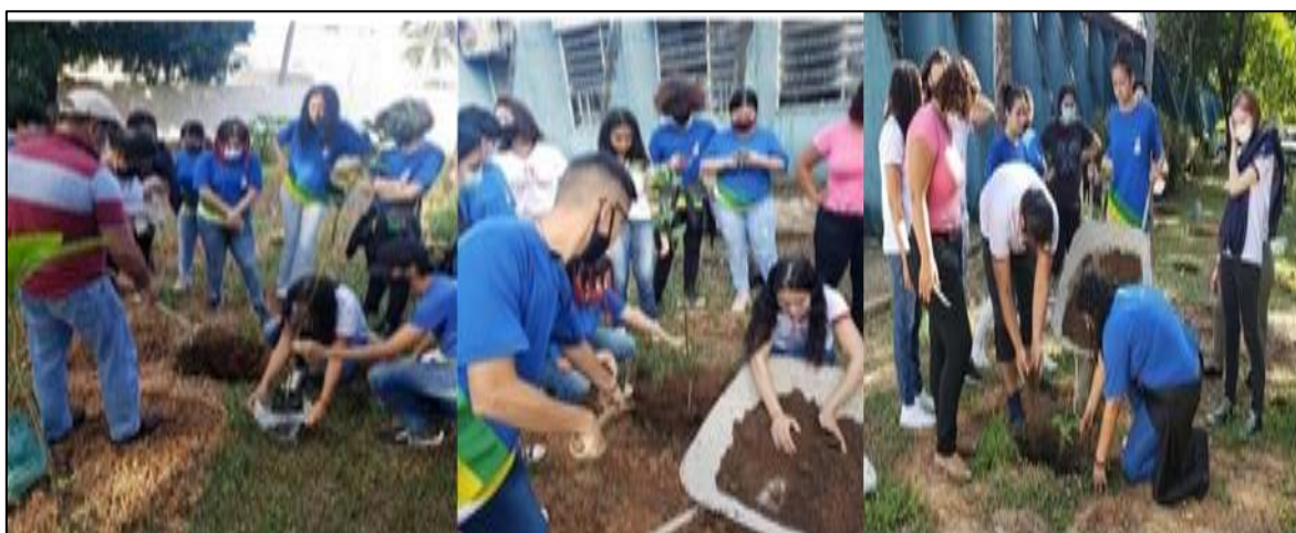
Figura 2 – Implantação do jardim Botânico.