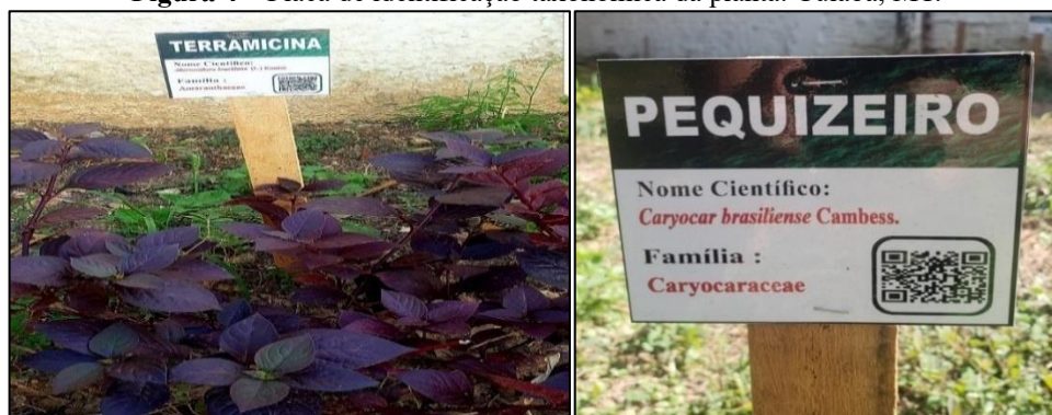
Figura 4 – Placa de identificação taxonômica da planta. Cuiabá, MT.

às informações adicionais sobre a planta: origem, propriedades medicinais, dentre outras informações relevantes para despertar na comunidade escolar o apreço pelo Jardim Botânico e sua conservação (Figura 4).