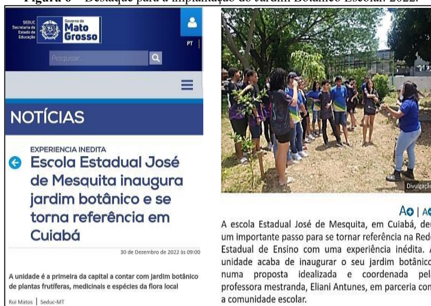
Figura 6 – Destaque para a implantação do Jardim Botânico Escolar. 2022.

escolas, tem-se a concepção de que: “[...]. Como resultado, os dados apontam para uma nova ordem comunicativa de sala de aula que amplia as possibilidades de participação, agentividade e protagonismo na construção conjunta de conhecimento. A implantação do Jardim Botânico teve o reconhecimento da SEDUC-MT em 30.12.2022 ao divulgar em seu site o projeto de implantação do Jardim botânico (Figura 6), destacando que o fato promove reflexão sobre o significado do movimento da comunidade escolar e assim, potencializando o foco na Educação Ambiental, conforme Figura 6.