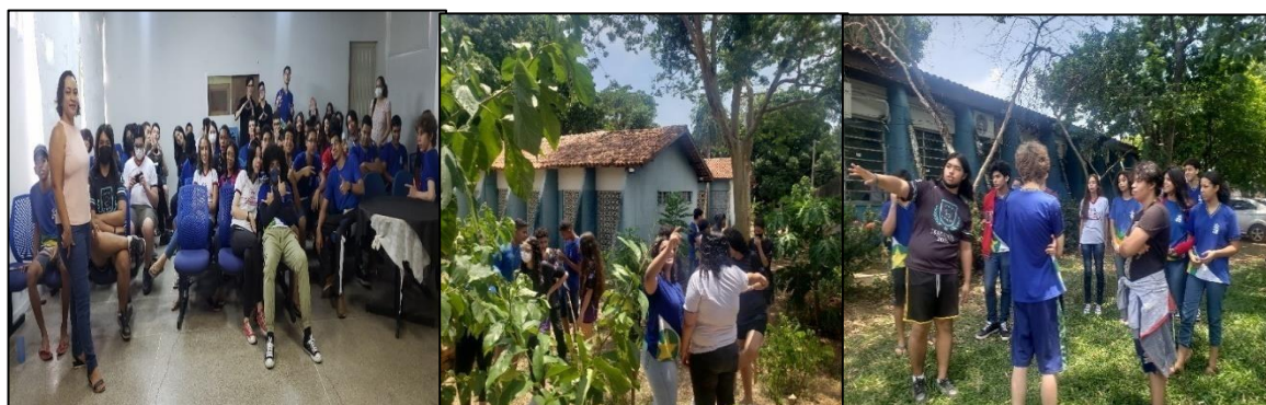
Figura 5 – Inauguração do Jardim Botânico da Escola José de Mesquita

Na comemoração ao “Dia da Árvore” em 21 de setembro de 2022 foi realizado um ato simbólico de abraço no Jardim Botânico. E a inauguração do Jardim Botânico da Escola José de Mesquita, ocorreu na data de 30 de novembro de 2022, envolvendo toda a comunidade escolar (Figura 5).