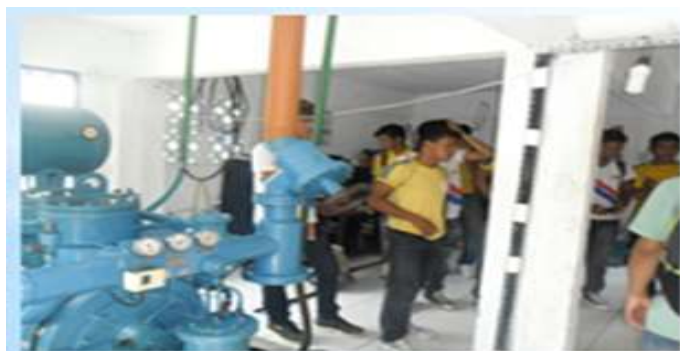
Figura 2 – Estudantes conhecendo a fábrica de gelo

Os espaços não-formais têm por sua finalidade levar ao educando outros meios de concepção, já que podem ser as vezes mais interessantes do que a sala de aula, segundo a ótica do aluno, principalmente se o professor desses discentes ainda está atrelado ao ensino tradicional ou conservador (JACOBUCCI, 2008).