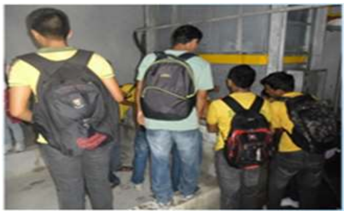
Figura 2 – Estudantes observando processos físicos

Ficou evidenciado na atividade que este mecanismo de compressão era o “coração” da fábrica de gelo, pois à medida em que a amônia por ele é comprimido, no mesmo momento, observou-se que é liberado um gás quente e um outro, frio, que ao se encontrarem, possibilita a expansão que absorve o calor do meio externo, onde é formado o gelo; por isso, é um processo reversível. Em síntese, esse foi um fenômeno termodinâmico e observado na prática pelos estudantes.