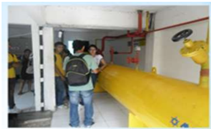
Figura 3 – Estudantes observando processos físicos

As reflexões realizadas no transcorrer da atividade confirmaram a importância da utilização de espaços não-formais para o ensino de Física, pois a animação e curiosidade dos estudantes era evidente em todo o transcorrer da visita guiada. Num dos momentos uma estudante comentou: “Professor, a gente não poderia vir aqui todas as semanas?” Neste momento o professor explicou a impossibilidade, porém, prometeu que a partir daquele momento, não apenas ele, mas também outros professores sairiam mais da sala de aula com os estudantes. Também enfatizou ser possível observar alguns fenômenos físicos na própria residência dos estudantes, citando como exemplo o congelamento dos alimentos. Para Oliveira (2000, p. 21): “nos dias de hoje ensinar ciências é também ter atenção para as questões ligadas a hábitos, costumes, crenças, tradições, que não são deixados pelo alunado do lado de fora da sala-de-aula”.