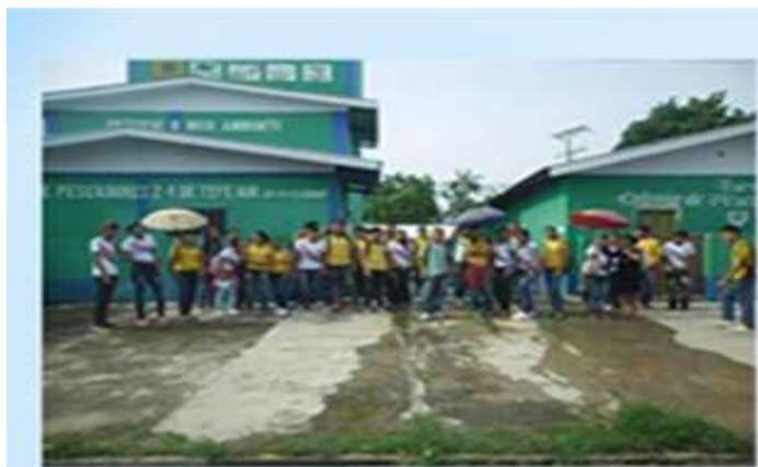
Figura 1 - Fachada da fábrica de gelo com os estudantes

Vale ressaltar que na visita à fábrica de gelo buscávamos comprovar que os conteúdos relacionados à termodinâmica repassados anteriormente na sala de aula também estavam presentes no cotidiano. Para isso, foi necessário que os mesmos observassem a realização dos fenômenos físicos in loco no ambiente da fábrica de gelo.