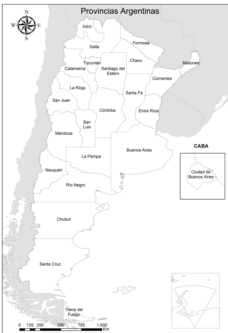
Mapa 1 República Argentina, según división político-territorial (provincias)

carga, trasbordo, depósito de mercadería y navegación en ese sistema fluvial, delegando en cada país la responsabilidad por el dragado y el balizamiento, en tanto que los convenios suscriptos con el Banco Interamericano de Desarrollo (BID) y el Programa de las Naciones Unidas para el Desarrollo (PNUD) otorgaron el financiamiento necesario para estudiar la factibilidad económica, técnica y ambiental de la explotación comercial de esa vía navegable. La HPP comenzó a funcionar formalmente en 1996, afianzándose luego gracias al Acuerdo de Cooperación Técnica entre la Corporación Andina de Fomento (CAF), el PNUD y el CIH para financiar los estudios tendentes a mejorar las condiciones de circulación. Los países miembros resolvieron entonces acordar un proyecto único de dragado y balizamiento entre Puerto Quijarro (Bolivia), Corumbá (Brasil) y Santa Fe (Argentina), orientado a garantizar la plena navegabilidad de la HPP durante los 365 días del año, las 24 horas del día.