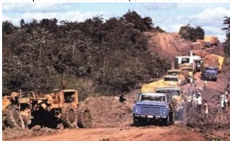
Figura 6: Caminhões de mudança transitando com dificuldades por trechos ainda não pavimentados da BR-364, em Rondônia nos anos 1970