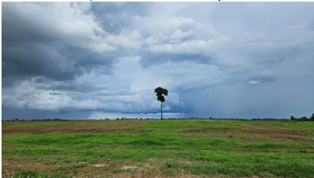
Figura 7: A solidão da castanheira, em terreno preparado para receber a semeadura da soja.

recentralização urbana 14 , conforme demonstram os dados dos censos de 1991, 2000, 2010 e 2022 afeta também os descendentes de trentinos.