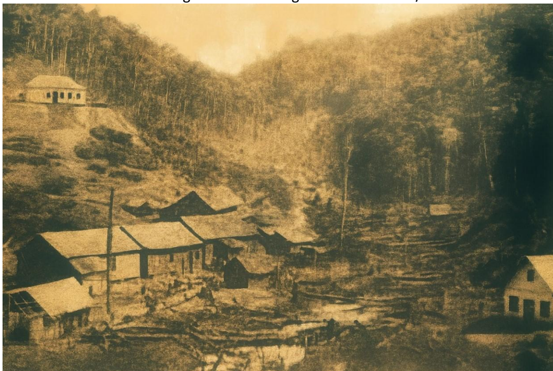
Figura 1: Foto antiga de Santa Teresa/ES