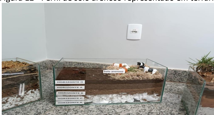
Figura 12 - Perfil de solo arenoso representado em terrário

A presença de material orgânico é geralmente limitada devido à rápida drenagem e à baixa capacidade de retenção de água desses solos. No entanto, em alguns casos, especialmente em ambientes úmidos ou onde há aporte significativo de matéria orgânica, pode haver a formação de horizontes mais ricos em material orgânico.