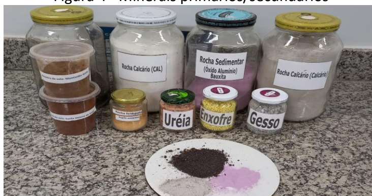
Figura 4 - Minerais primários/secundários

Além disso, os estudantes foram incentivados a explorar as diferentes propriedades mineralógicas presentes nos solos. Para isso, foram utilizados materiais geogênicos, como silte, argila e areia, além de materiais pedogênicos, como minerais silicatados e óxidos de ferro e alumínio. Essa exploração possibilitou uma compreensão mais profunda da composição e das características dos solos, refletindo a interação entre os fatores geológicos e pedológicos na formação e evolução dos perfis de solos (Figura 4).