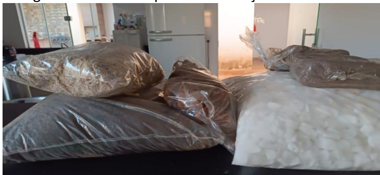
Figura 3 - Materiais para a construção dos terrários.

dos perfis dos solos nos terrários foram selecionados com base em critérios técnicos que garantem a fidelidade na representação dos processos pedológicos e a eficiência no ensino prático. Em seguida, foi explicada a importância de cada um dos materiais empregados: