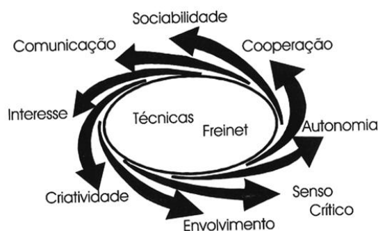
Figura 1 - Técnica de Freinet (1975)

Fonte: SCARPATO, M. Didática e desenvolvimento integral. São Paulo: Avercamp, 2012.