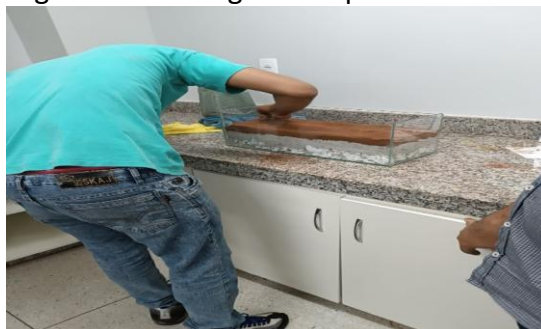
Figura 6 - Montagem dos perfis dos solos

Com base nesse conceito, os estudantes foram ativamente envolvidos na montagem dos perfis dos solos nos terrários, o que os motivou a aplicar os conhecimentos teórico-práticos adquiridos. Ao mesmo tempo, tiveram a oportunidade de observar e experimentar com os diversos componentes do solo em um ambiente controlado, obtendo uma compreensão integrada do conteúdo estudado (Figura 6).