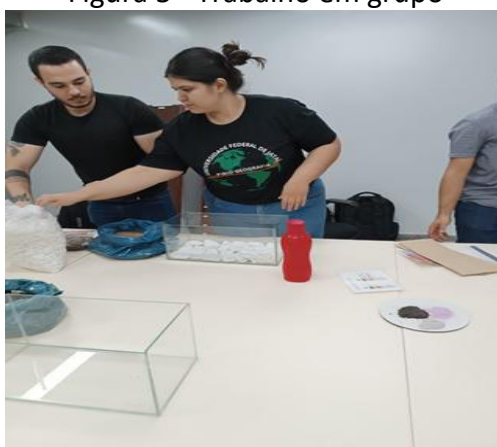
Figura 5 - Trabalho em grupo

Essa abordagem, em consonância com a pedagogia de Freinet (1975), enfatizou o trabalho cooperativo e a construção conjunta do conhecimento, permitindo que os estudantes vivenciassem a integração entre as teorias e as práticas pedológicas. Em seguida, todos os recipientes foram catalogados pelos estudantes, com o respectivo nome dos óxidos e minerais, facilitando a identificação e organização dos elementos presentes nos terrários.