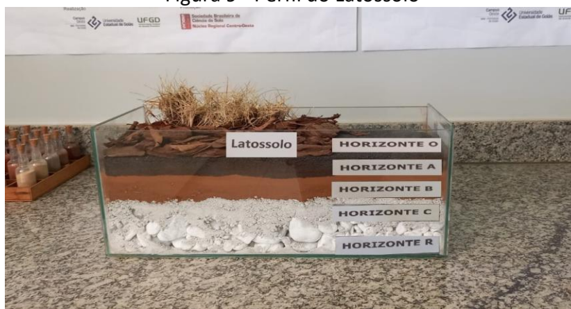
Figura 9 - Perfil do Latossolo

Os Latossolos são tipos de solo comumente encontrados em regiões tropicais e subtropicais, especialmente no Brasil. Eles são caracterizados por serem solos profundos, bem drenados e com baixa fertilidade natural. Apesar de sua baixa fertilidade natural, os Latossolos são frequentemente utilizados na agricultura, especialmente em culturas tropicais como soja, milho, café e cana-de-açúcar. Geralmente, exigem a aplicação de fertilizantes e técnicas de manejo adequadas para melhorar sua fertilidade e sustentabilidade em longo prazo (SANTOS et al. , 2020) (Figura 9).