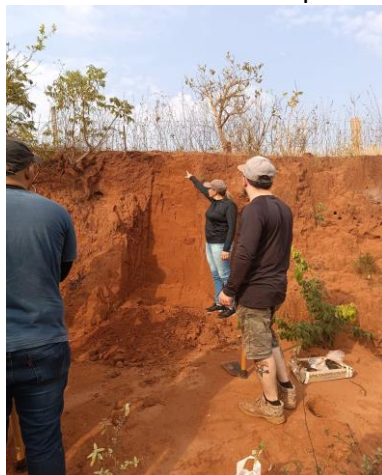
Figura 10 - Levantamento de perfil de solo

favorecendo a integração entre Pedologia, Biologia e Educação Ambiental, conforme defendem Cavalcanti (2019) e Embrapa (2018).