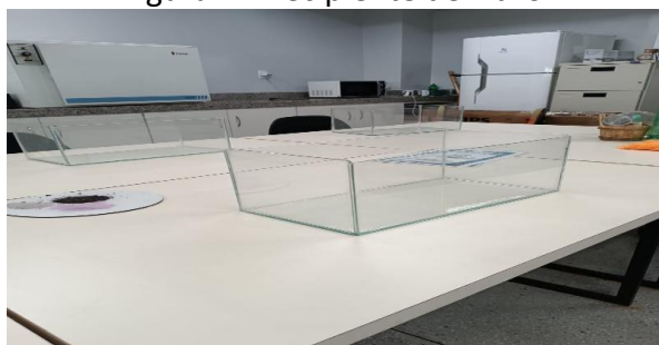
Figura 2 - Recipiente de vidro.

Assim, a transparência dos recipientes possibilitou uma análise detalhada da textura e das camadas do solo, favorecendo a autonomia dos educandos na observação e no registro dos fenômenos (Figura 2).