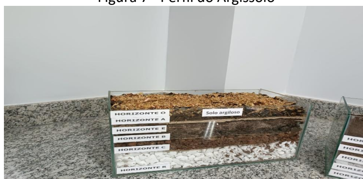
Figura 7 - Perfil do Argissolo

No terrário representativo do Argissolo, observou-se uma textura argilosa e úmida, composta por camadas ricas em argila e óxidos de ferro e alumínio. Na superfície, destaca-se uma camada de matéria orgânica, responsável por maior fertilidade e coloração mais escura. Essa estrutura evidencia a diferenciação de horizontes típica dos Argissolos, em que ocorre acúmulo de argila no horizonte B e translocação de partículas a partir das camadas superiores (EMBRAPA, 2018) (Figura 7).