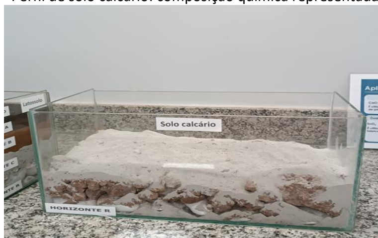
Figura 11 – Perfil de solo calcário: composição química representada no terrário

Na Figura 11, apresenta-se o terrário construído para representar a composição química do solo derivado de rochas calcárias. Esse tipo de solo caracteriza-se pela elevada concentração de carbonato de cálcio ( \text{CaCO}_3 ), o que lhe confere pH mais alcalino e menor acidez em comparação com outros solos do Cerrado. Os solos calcários se formam a partir da alteração química das rochas carbonáticas, compostas predominantemente por carbonato de cálcio. Essa composição influencia a disponibilidade de nutrientes, a estrutura e a fertilidade do solo, sendo um fator importante na dinâmica química e biogeoquímica dos ecossistemas (EMBRAPA, 2018).