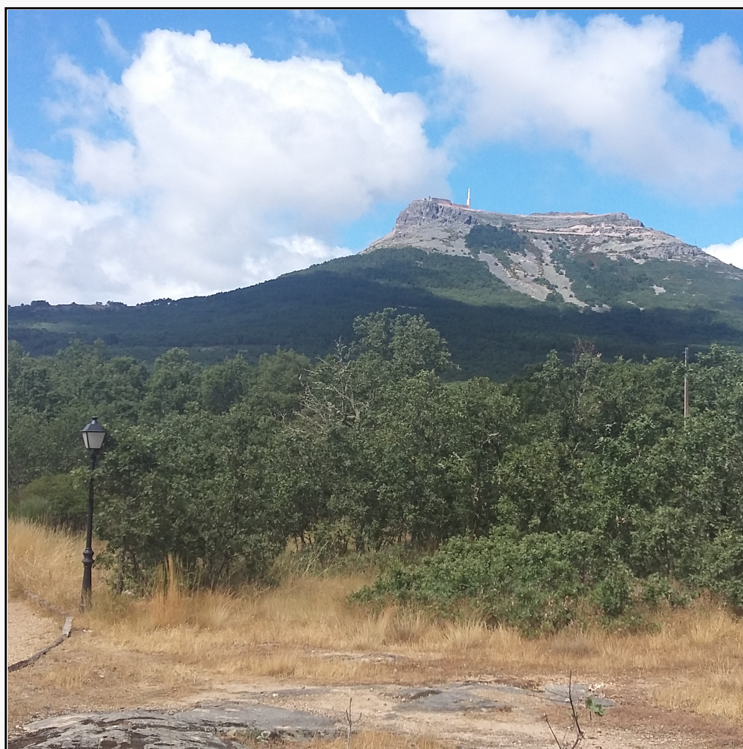
Sierra de Francia (Salamanca - Espanha)

ISSN 2236-9716 Barra do Garças- MT V.11, n.2 dez-2021