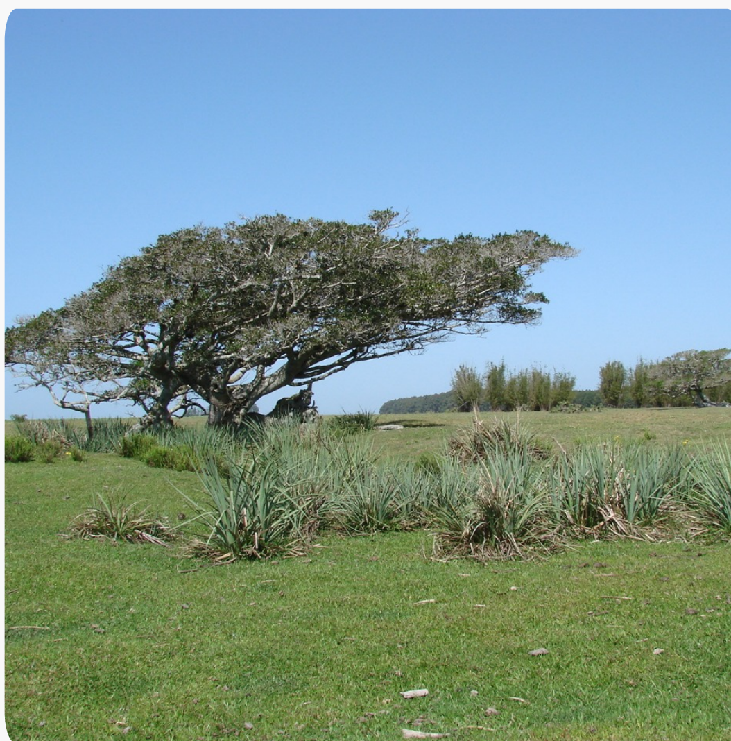
Estação Ecológica do Taim (Rio Grande/Santa Vitória do Palmar - RS)