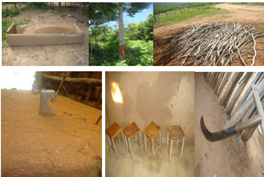
Figura 2: Utilização dos recursos florestais para o preparo de artefatos: Figura (1) uso tecnológico para Cocho (vasilha grande feita de um tronco de árvore cavado); (2) Retirada de casca; (3) uso combustível para lenha; (4) uso tecnológico para torno de rede; (5) uso tecnológico para bancos; (6) cabo de ferramenta.