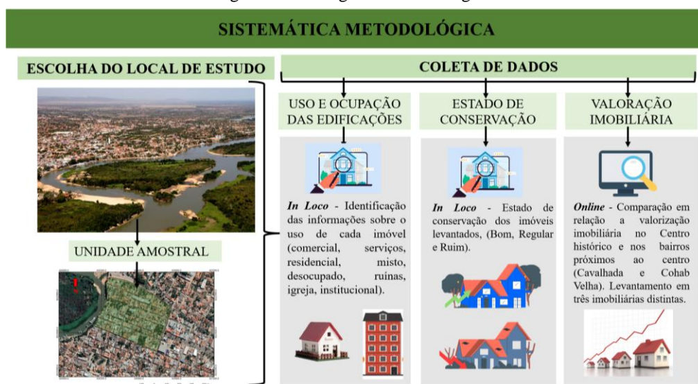
Figura 1 – Fluxograma Metodológico.

O trabalho foi sistematizado, seguindo um roteiro para que o levantamento de dados ocorresse de maneira organizada e funcional. A Figura 1 representa sistematicamente as etapas metodológicas adotadas.