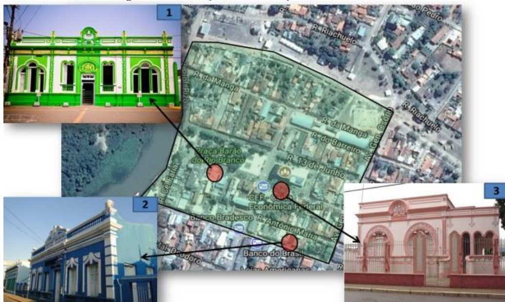
Figura 4. Construções históricas preservadas.

A edificação de serviço (1) encontra-se em um local de destaque, pois está em frente a praça Barão do Rio Branco, praça da Matriz, sendo hoje utilizada para serviços bancários. A edificação desocupada (2) é o antigo clube Humaitá que devido a mudança de hábitos das pessoas encontra-se fechado em sem utilização, mas ainda faz parte do imaginário popular como local de lazer importante para a memória Cacerense (SILVA et al., 2016, p.446). A edificação residencial (3), conhecida popularmente como “Casa Rosa”, encontra-se preservada e o seu uso ainda é residencial preservando assim as suas características originais sem modificações externas ou internas.