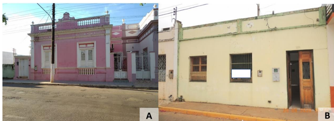
Figura 5 – Imóveis à venda no centro histórico.

Entre muitos princípios e dilemas a preservação e valorização do patrimônio histórico depende de muitas circunstâncias e variáveis. No caso da cidade de Cáceres é importante salientar a relação e interesses a que estão ligados. Em estudo realizado por da Costa (2020), os proprietários e locatários dos imóveis no centro histórico, apresentam dificuldades em ler os conflitos de interesse por detrás do tombamento e, principalmente, em ter um entendimento sobre a burocracia que rege esses interesses.