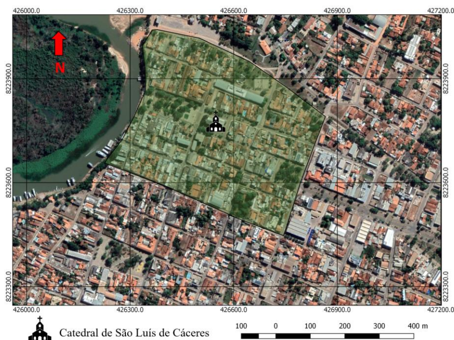
Figura 3 – Área amostral no centro histórico de Cáceres-MT.

As ruas perpendiculares são (Rua Quintino Bocaiuva, Rua do Barreiro, Rua 13 de Junho, Rua João Pessoa, Rua Antônio Maria) e as paralelas são (Rua Prof. Rizo/Coronel Faria, Av. General Osório, Rua Comandante Balduino).