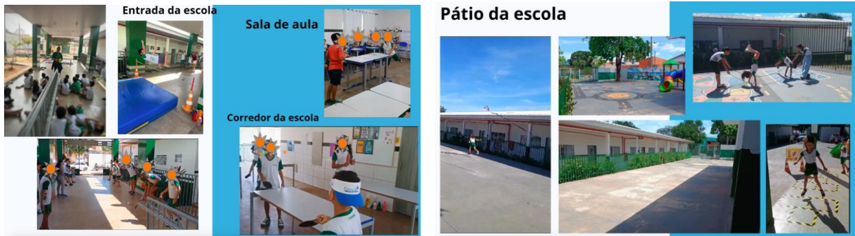
Figura 2 e 3 – Slides aulas de Educação Física sendo realizadas em diferentes espaços da escola

“Não tem mesa. Onde vai trabalhar? Com o que tem. A gente improvisou as mesas no corredor da escola, do refeitório” (ver figuras 2 e 3).