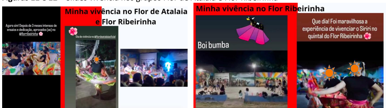
Figuras 11 e 12 – Slides vivência nos grupos Flor de Atalaia e Flor Ribeirinha

A professora descobriu que a escola possuía trajes típicos do siriri guardados, mas que nunca tinha sido utilizados. Ela iniciou um processo de formação pessoal para garantir que o ensino fosse qualificado em relação à essência da dança. “A primeira coisa que eu fiz foi tentar entrar num grupo de siriri para conhecer como que funciona.”