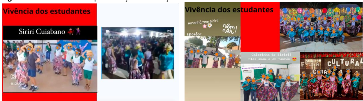
Figuras 9 e 10 – Slides de apresentações da dança Siriri na escola

A experiência despertou na professora o desejo de levar aquela manifestação cultural para o contexto das aulas. Embora o tema já tivesse sido abordado em algumas formações continuada da rede, foi “sempre de forma superficial, nunca dava tempo de aprofundar”, foi a apresentação ao vivo na escola que acendeu a motivação para uma abordagem mais profunda sobre esta dança tradicional.