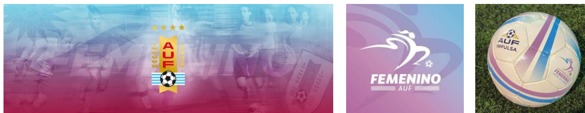
Figura 1, 2 Y 3 – Imágenes institucionales AUF Femenino