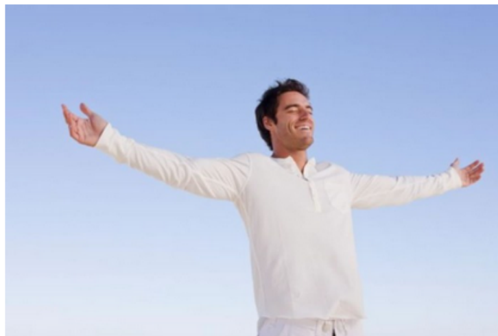
Figura 2: Página introdutória do website http://cancer.roo.ufmt.br/prostata .

A proposta “ Este clique pode salvar sua vida ” nasceu como um braço do projeto Câncer de Próstata: Prevenção, percepção e rastreamento. Este espaço é destinado ao compartilhamento de informações básicas a respeito do câncer de próstata e, principalmente, para tirar toda e qualquer dúvida. O projeto conta com o apoio de profissionais especializados para responde-las. Estar bem informado pode salvar sua vida e das pessoas que lhes são queridas! Acesse a aba informacional para saber mais sobre o câncer de próstata. Não deixe de clicar na aba: “ Este clique pode salvar sua vida ” e tirar suas dúvidas sobre o câncer, sintomas, tratamentos ou qualquer outra!