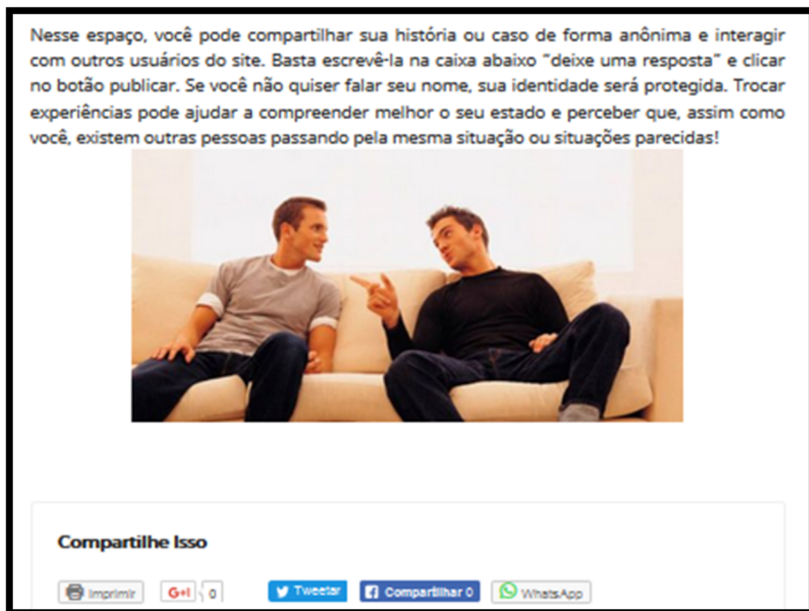
Figura 4: Espaço “compartilhe sua ideia do website: http://cancer.roo.ufmt.br/prostata e ferramentas de compartilhamento interativo para redes sociais.

Por fim, além das páginas mencionadas anteriormente, o website conta, ainda, com dispositivos de compartilhamento das publicações. Essa ferramenta foi desenvolvida visando uma interação da vida pós-moderna dos usuários através de redes sociais, em que eles podem – se desejarem –, compartilhar as perguntas e relatos públicos nas seguintes plataformas: whatsapp , facebook , google+ e twitter .