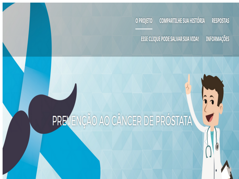
Figura 1: Estrutura base do website: http://cancer.roo.ufmt.br/prostata .