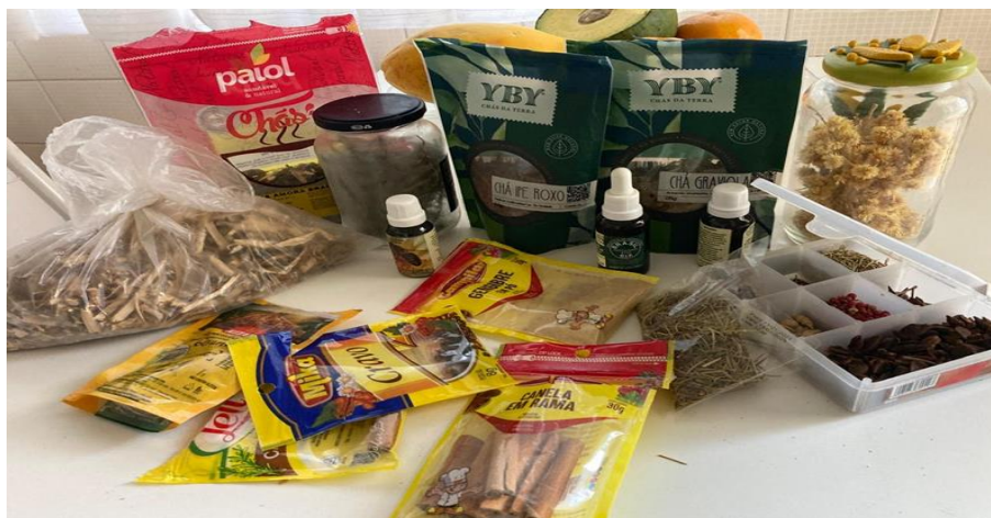
Figura 2. Produtos florestais não madeireiros comercializados em Cuiabá. MT.