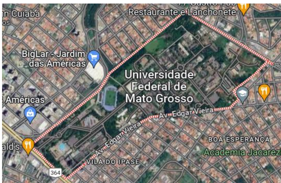
Figura 1. Imagem de satélite de estudo. 2023. Fonte: Google Maps. 2023.

A coleta das plantas se deu no campus de Cuiabá da Universidade Federal de Mato Grosso - UFMT (Figura 1), que tem como endereço R. Quarenta e Nove, 2367 - Boa Esperança, Cuiabá - MT, 78060-900, e coordenadas 15° 36' 31" S, 56° 03' 49" O, durante os meses de fevereiro a março de 2023.