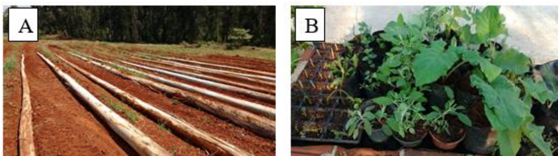
Figura 1: Implantação do horto didático na Universidade Federal da Fronteira Sul (UFFS), campus Chapecó. Correspondente a etapa 1 (Projeto) no programa PBFARMA. (1A – Imagem do horto no início do preparo dos canteiros; 1B – Imagem de algumas das espécies em processo de multiplicação).

A implantação do horto medicinal na UFFS-Chapecó representa um importante passo para a prática do ensino, da pesquisa e da extensão na área. O cumprimento de muitos objetivos do programa PBFARMA é dependente da existência do horto, como a identificação de espécies, coleta, formulação de preparados, manejo e uso das plantas e compostos, entre outras. Além disso, o espaço físico didático proporciona a interação com os alunos na prática. Neste sentido, as atividades iniciais do programa PBFARMA começaram pela definição e escolha do local pela limpeza da área, formação dos canteiros, colocação dos eucaliptos para melhor contenção e organização do horto, Figura 1A, juntamente com o início da produção das mudas, como podemos observar na Figura 1B.