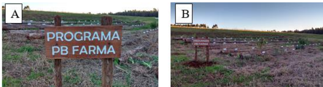
Figura 4: Identificação do horto. (4A – Placa de identificação do programa PBFARMA; 4B – Visão mais ampla do horto ao fundo).

Na Figura 4A podemos visualizar a placa de identificação do programa PBFARMA e uma visão do horto ao fundo, Figura 4B.