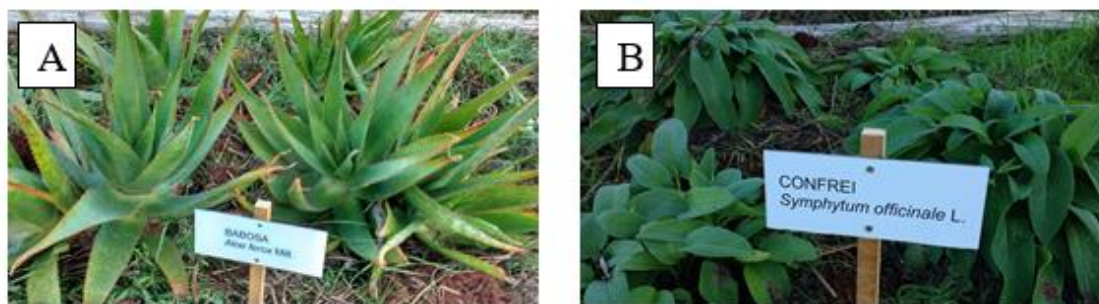
Figura 3: Identificação individual das espécies implantadas, com nome comum e científico. (3A – Babosa – Aloe ferox Mill.; 3B – Confrei – Symphytum officinale L.)